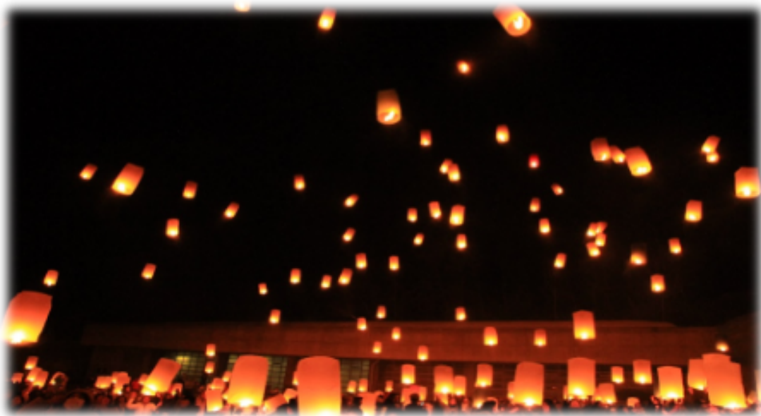
スカイランタン の宿