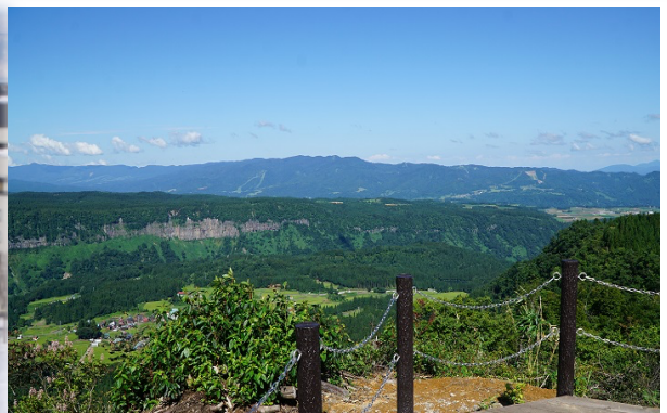
苗場山麓ジオパーク ニュー・グリーンピア津南展望台